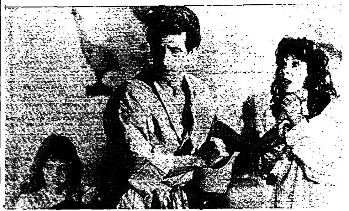
المهاجرة شغل العائلة، عوى الابنة الصغيرة